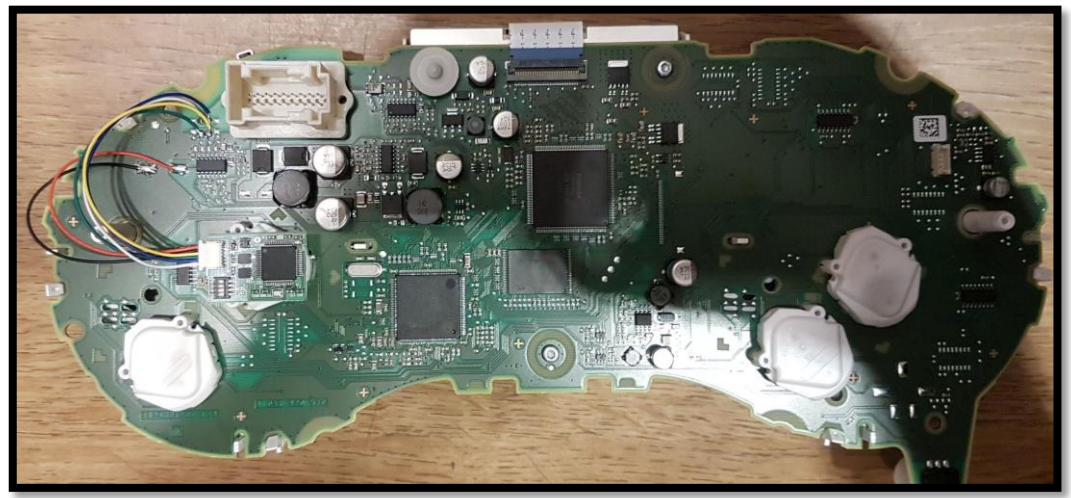
Can Filter RX_RX Mercedes W166, W246 Block synchro EZS-Dashboard (required)